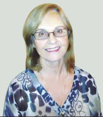
Γράφει η Δέσποινα Μπαχά