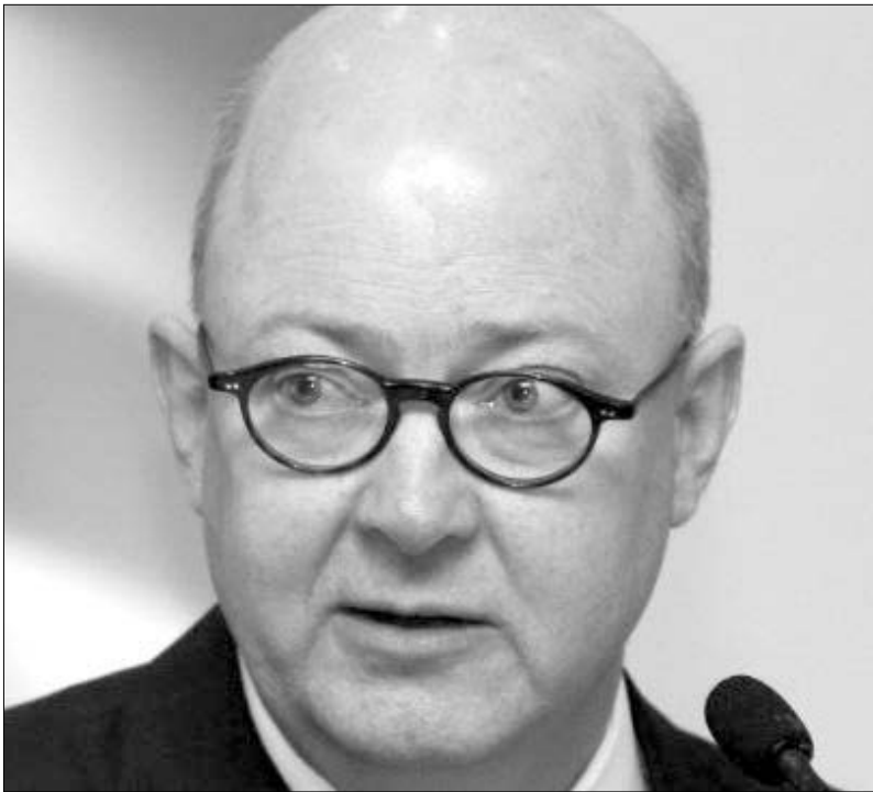
Ο Γενικός Διευθυντής της News Ltd, Κιμ Ουίλιαμς.

Σε μαζικές απολύσεις θα προβεί και το εκδοτικό συγκρότημα της News Ltd, καθώς ο όμιλος στρέφει την προσοχή του στις διαδικτυακές εκδόσεις. Ο Γενικός Διευθυντής της News Ltd, Κιμ Ουίλιαμς, αναμένεται να προβεί σε σχετική ανακοίνωση εντός των ημερών. Στα σχέδια για την αλλαγή της δομής του ομίλου, που τυπώνει τις εφημερίδες The Australian, The Daily Telegraph και Herald Sun, αναμένεται να περιλαμβάνονται και μαζικές απολύσεις στα ίδια επίπεδα με αυτά που ανακοίνωσε την Δευτέρα ο δεύτερος μεγαλύτερος εκδοτικός όμιλος της χώρας, Φαίρφαξ.