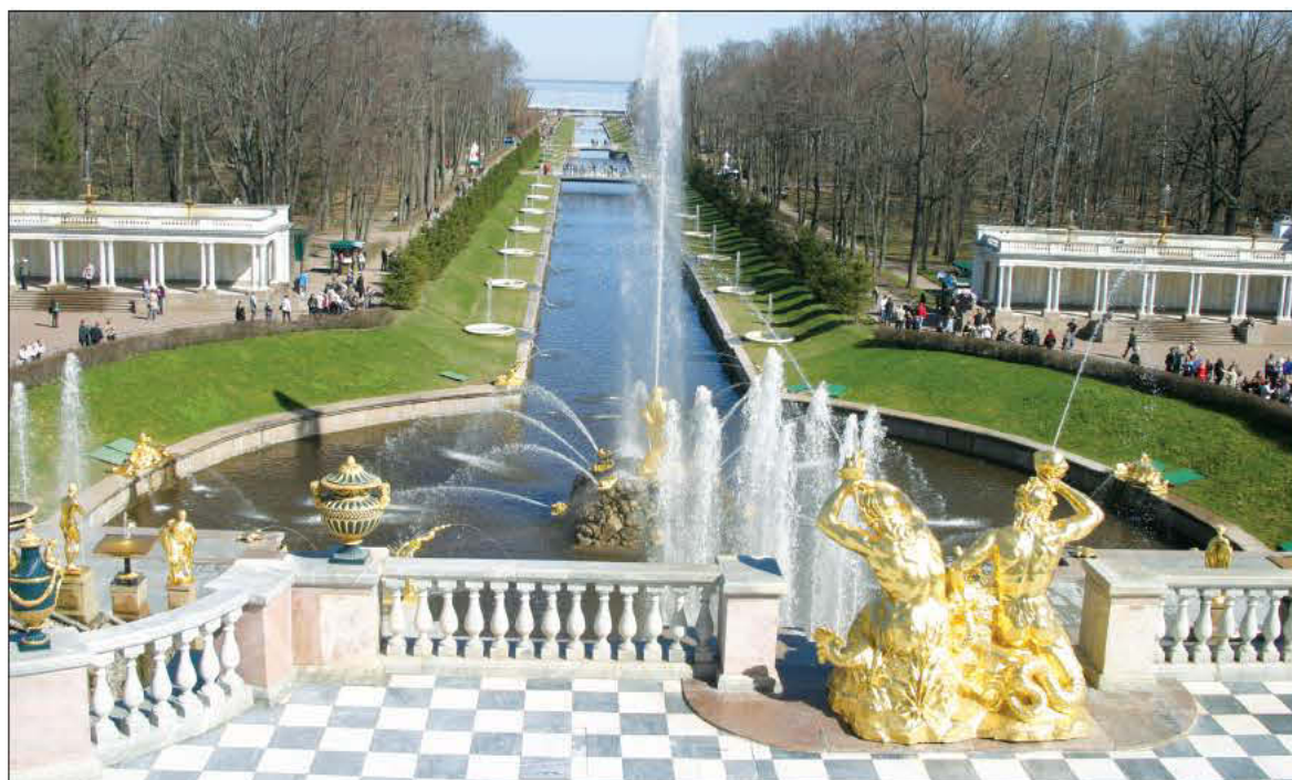
Τους κήπους του Παλατιού Πίτεργκοφ στολίζουν εκατοντάδες επίχρυσα αγάλματα (πολλά εμπνευσμένα από την ελληνική μυθολογία και αμέτρητα σιντριβάνια).

1917, λίγο πριν την επανάσταση των μπολσεβίκων. Πολέμησε στο ρωσοφινλανδικό πόλεμο, στον β' παγκόσμιο εναντίον των Γερμανών και εναντίον των Ιαπώνων. Έχει παρασημοφορηθεί αμέτρητες φορές για ανδραγαθήματα. «Ούτε που θυμάμαι πόσες φορές με έχει τιμήσει η πατρίδα» μου λέει και προσθέτει: «...μεγαλύτερη, για μένα, σημασία έχει το τι έκανα εγώ για την πατρίδα και όχι τι έχει κάνει αυτή για μένα». Στο μεταξύ πολλοί περαστικοί τον έχουν αναγνωρίσει από τις φωτογραφίες του στον Τύπο και τις εμφανίσεις του στην τηλεόραση και μας έχουν «περικυκλώσει». Ορισμένοι του φιλούν με ευγνωμοσύνη το χέρι, άλλοι θέλουν να φωτογραφηθούν μαζί του και άλλοι πάλι του ζητούν ένα αυτόγραφο. Δέχεται με μια αγνή απλότητα τις εκδηλώσεις αγάπης και ευγνωμοσύνης και δεν αφήνει κανέναν παραπονεμένο.