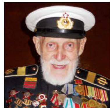
Ο 95χρονος Μιχαήλ Βασιλιεβιτς Ποντγκούρσκι. Ο πιο παρασημοφορημένος εν ζωή παλαιμάχος πολεμιστής στη Ρωσία.

1917, λίγο πριν την επανάσταση των μπολσεβίκων. Πολέμησε στο ρωσοφινλανδικό πόλεμο, στον β' παγκόσμιο εναντίον των Γερμανών και εναντίον των Ιαπώνων. Έχει παρασημοφορηθεί αμέτρητες φορές για ανδραγαθήματα. «Ούτε που θυμάμαι πόσες φορές με έχει τιμήσει η πατρίδα» μου λέει και προσθέτει: «...μεγαλύτερη, για μένα, σημασία έχει το τι έκανα εγώ για την πατρίδα και όχι τι έχει κάνει αυτή για μένα». Στο μεταξύ πολλοί περαστικοί τον έχουν αναγνωρίσει από τις φωτογραφίες του στον Τύπο και τις εμφανίσεις του στην τηλεόραση και μας έχουν «περικυκλώσει». Ορισμένοι του φιλούν με ευγνωμοσύνη το χέρι, άλλοι θέλουν να φωτογραφηθούν μαζί του και άλλοι πάλι του ζητούν ένα αυτόγραφο. Δέχεται με μια αγνή απλότητα τις εκδηλώσεις αγάπης και ευγνωμοσύνης και δεν αφήνει κανέναν παραπονεμένο.