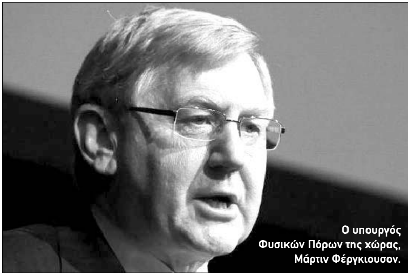
Ο υπουργός Φυσικών Πόρων της χώρας, Μάρτιν Φέργκιουσον.