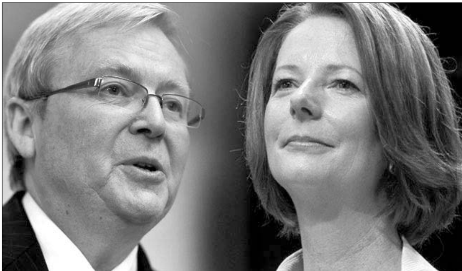
Η Αυστραλία βρισκόταν σε καλύτερη θέση επί ηγεσίας Κέβιν Ραντ απ' ότι είναι σήμερα επί κυβέρνησης Γκίλαρντ, υποστηρίζει η τελευταία δημοσκόπηση της Galaxy.

Τέλος, ο Συνασπισμός αναμένεται να εξαπολύσει επίθεση κατά του υπουργού Περιβάλλοντος, Τόνι Μπερκ, για την πρότασή του να δημιουργηθεί στην Αυστραλία το μεγαλύτερο δίκτυο θαλάσσιων πάρκων στον κόσμο.