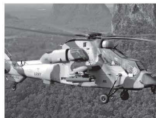
Ελικόπτερο Tiger της Αυστραλίας.

Τη 21η Ιουνίου τα Tiger πρόκειται να συμμετέχουν στη μεγάλη επίσημη άσκηση του στρατού Hamel, διάρκειας 3 εβδομάδων.