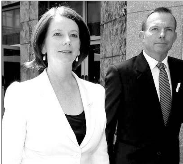
Δημοφιλέστερη του αρχηγού της αντιπολίτευσης, Τόνι Άμποτ, παραμένει η πρωθυπουργός Τζούλια Γκίλαρντ.

Την ίδια ώρα, σε ανοδική πορεία βρίσκεται και η προσωπική