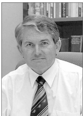
Ο υπουργός Τοπικής Αυτοδιοίκησης της N.N.O., Ντον Πέιτζ.

διοίκησης της N.N.O., Ντον Πέιτζ, δήλωσε χθες ότι ο φόρος ρύπανσης θα σπρώξει ανοδικά τα δημοτικά τέλη στην πολιτεία. «Ο φόρος ρύπανσης δεν θα αυξήσει μόνο τους λογαριασμούς κατανάλωσης ηλεκτρικού ρεύματος. Θα σπρώξει ανοδικά και τα έξοδα των δήμων, που αναπόφευκτα θα περάσουν το κόστος στα δημοτικά τους τέλη», τόνισε ο κ. Πέιτζ. Στη συνέχεια ο υπουργός έδωσε σαν παράδειγμα την Δημαρχία του Σίδνεϊ, όπου ο φόρος ρύπανσης αναμένεται να αυξήσει τα έξοδά της κατά $921,327.