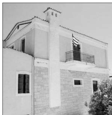
Το Μουσείο Καζαντζάκη

Η διαδικασία προβλέπει τη δεκάλεπτη παρουσίαση εκάστου μουσείου από τον αντιπρόσωπό του, μέσω ερωτήσεων που απευθύνουν τα μέλη της επιτροπής. Η συνέντευξη κλείνει με την παρου-