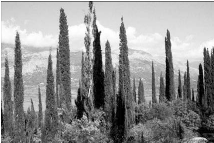
Και το μεσογειακό κυπαρίσσι κατάγεται από κυπαρισσοειδή της Παγγαίας

Η νέα μελέτη είναι η πρώτη που εντοπίζει ανάλογες ενδείξεις στο βασίλειο των φυτών. «Μέχρι σήμερα δεν υπήρχαν αντίστοιχα ευρήματα για καμία