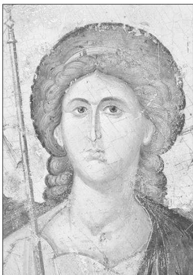
Η μεγάλη έκθεση με 116 έργα από ελληνικά μουσεία θα ταξιδέψει, μετά τις ΗΠΑ, στην Ιταλία, ενώ δεν αποκλείεται να ακολουθήσει και η Ρωσία. Στην φωτογραφία εικόνα του Αρχαγγέλου Μιχαήλ (14ος αιώνας).

• «Ο χριστιανικός κόσμος» αναφέρεται στη χριστιανική ταυτότητα της Βυζαντινής Αυτοκρατορίας και αποσκοπεί στην παρουσίαση της καθιέρωσης του χριστιανισμού ως μίας και μόνης θρησκείας του κράτους.