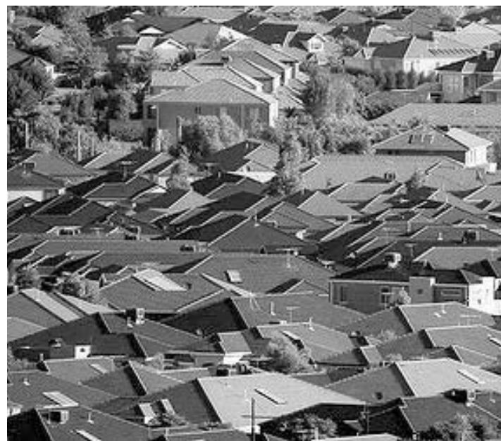
Στα 7,3 εκατομμύρια κατοίκους θα ανέλθει ο πληθυσμός της Βικτώριας μέχρι το 2031.

Στα 7,3 εκατομμύρια κατοίκους θα ανέλθει ο πληθυσμός της Βικτώριας μέχρι το έτος 2031 και η αύξηση αυτή θα οφείλεται κυρίως στη μετανάστευση παρά στη γεννητικότητα. Μέσα στις επόμενες δύο δεκαετίες ο πληθυσμός της πολιτείας αναμένεται να αυξηθεί κατά 1,7 εκατομμύρια κατοίκους και οι περιοχές που θα γνωρίσουν την μεγαλύτερη πληθυσμιακή ανάπτυξη είναι η Cardinia, η Casey, η Hume, η Melton, η Whittlesea και η Wyndham. Σημαντική πληθυσμιακή ανάπτυξη θα γνωρίσουν επίσης τα εσωτερικά προάστια της Μελβούρνης, Port Phillip, Yarra και Maribymong, καθώς και οι επαρχιακές κωμόπολεις του Geelong, του Ballarat, του Bendigo και του Latrobe Valley. Σχολιάζοντας τα στοιχεία αυτά ο αρμόδιος υπουργός, Matthew Guy, τόνισε ότι η πληθυσμιακή αύξηση θα προέλθει από τη μετανάστευση και όχι από τη συχνότητα των γεννήσεων. «Στα επόμενα 40 χρόνια ο μέσος όρος ηλικίας στην πολιτεία μας θα αυξηθεί από 37 σε 41, ενώ