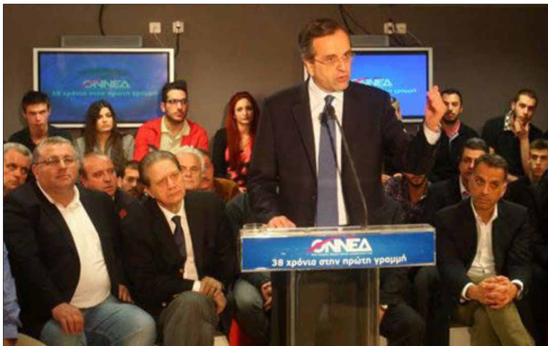
Ο Αντώνης Σαμαράς στην εκδήλωση στα γραφεία της ΟΝΝΕΑ.

Για την Κυριακή αναβλήθηκε η προγραμματισμένη για χθες, Πέμπτη, παρουσίαση του οικονομικού προγράμματος της Νέας Δημοκρατίας στο Ζάππειο, λόγω της απεργίας των τεχνικών που εργάζονται σε ιδιωτικούς τηλεοπτικούς σταθμούς.