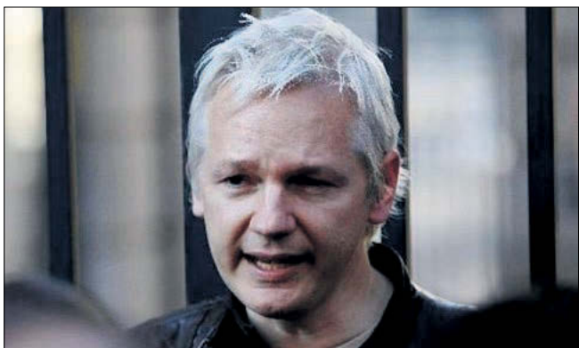
Ο Τζούλιαν Ασάντζ δήλωσε ότι στην εκπομπή του θα προσκαλεί ανθρώπους στους οποίους «η τηλεόραση απλά δεν θα έδινε ποτέ την ευκαιρία να μιλήσουν».

Η τηλεοπτική εκπομπή διαλόγου την οποία θα παρουσιάζει ο ιδρυτής του ιστοτόπου WikiLeaks Τζούλιαν Ασάντζ και θα μεταδίδεται από το τηλεοπτικό δίκτυο Russia Today θα αρχίσει να προβάλλεται σήμερα, Τρίτη 17 Απριλίου, όμως ο κατάλογος των καλεσμένων του θα παραμείνει μυστικός, όπως ανακοίνωσε το αγγλόφωνο τηλεοπτικό δίκτυο το οποίο χρηματοδοτείται από την ρωσική κυβέρνηση. Ο Ασάντζ, που συνεχίζει να τελεί υπό κατ'οίκον σύλληψη στη Βρετανία - προσπαθώντας να αποφύγει την έκδοσή του στη Σουηδία για σεξουαλική επίθεση που ο ίδιος διαψεύδει και υποστηρίζει ότι αποτελεί μέρος ενός σχεδίου με στόχο να εκδοθεί στις ΗΠΑ - γύρισε την εκπομπή «The World Tomorrow» («Ο Κόσμος Αύριο») στη Βρετανία. Το τηλεοπτικό δίκτυο ανέφερε ότι δεν θα δημοσιοποιήσει τον κατάλογο των καλεσμένων του πριν από την προβολή της εκπομπής, πάντως πρόσβλεψε ότι η πρώτη συνέντευ-