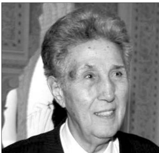
Ο Μπεν Μπελά το 2008.

Τέθηκε υπό κράτηση μέχρι το 1980 ενώ αργό-