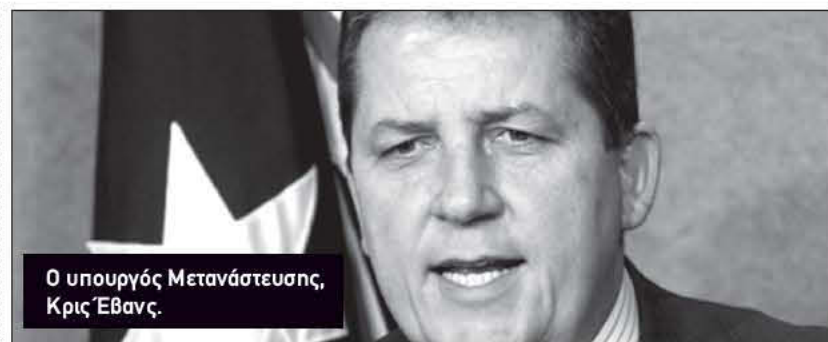
Ο υπουργός Μετανάστευσης, Κρις Έβανς.

απέναντι στα ναρκωτικά, πριν επανέλθει ενεργά στην πολιτική και αναλάβει επικεφαλής του αυστραλιανού υπουργείου Εξωτερικών. Αναφερόμενος στο καυτό αυτό κοινωνικό πρόβλημα είπε ότι δεν πιστεύει πως κυνηγώντας τους χρήστες μαριχουάνας πίνουν τόπο οι προσπάθειες της αστυνομίας. «Όταν ήμουν ακόμα πρωθυπουργός της Νέας Νότιας Ουαλίας είχα καταλήξει στο συμπέρασμα ότι κυνηγώντας τους χρήστες μαριχουάνας δεν οδηγούμεθα πουθενά», ανέφερε.