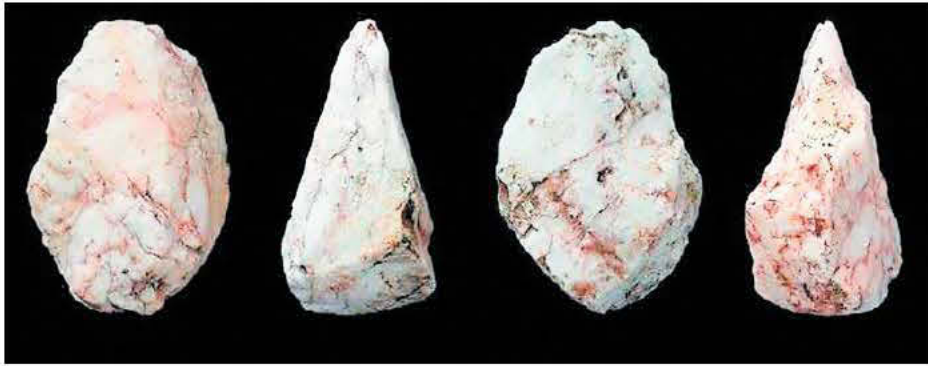
Ξύστρες, ακίδες, μικρόλιθοι, οδοντωτά εργαλεία και εργαλεία με εγκοπές μαρτυρούν την ευρεία χρήση τεχνολογίας

Εκατόν τριάντα χιλιάδες χρόνια πριν, στον Πλακιά της Κρήτης, έφτασε μια μονάδα ανθρωποειδών μέσω θαλάσσης και κατοίκησε την περιοχή. Η απουσία οσκελετικών καταλοίπων επιτρέπει στους επιστήμονες να κάνουν μονάχα ειδικασίες για το είδος, λέγοντας ότι ίσως ήταν Homo haidelbergensis ή erectus.