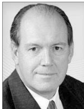
Ο σκωδης υπουργός Άμυνας, Ντέιβιντ Τζόνσον.

Ο σκωδης υπουργός Άμυνας, Ντέιβιντ Τζόνσον, πολύ επιφυλακτικά τόνισε ότι θα ήθελε να μελετήσει τις λεπτομέρειες της πρότασης χωρίς να δεσμευτεί ότι είναι διατεθειμένος να δώσει - όπως είπε - λευκή επιταγή στις ΗΠΑ. Σε ερώτηση δημοσιογράφου αν μια κυβέρνηση Συνασπισμού είναι διατεθειμένη να ενοικιάσει τα Νησιά Κόκος στις Ηνωμένες Πολιτείες - για να χρησιμοποιηθούν ως στρατιωτική βάση - ο γεροισιαστής Τζόνσον τόνισε ότι σίγουρα θα εξεταστεί θετικά η πρόταση για οποιαδήποτε αμερικανική βοήθεια στην περιοχή.