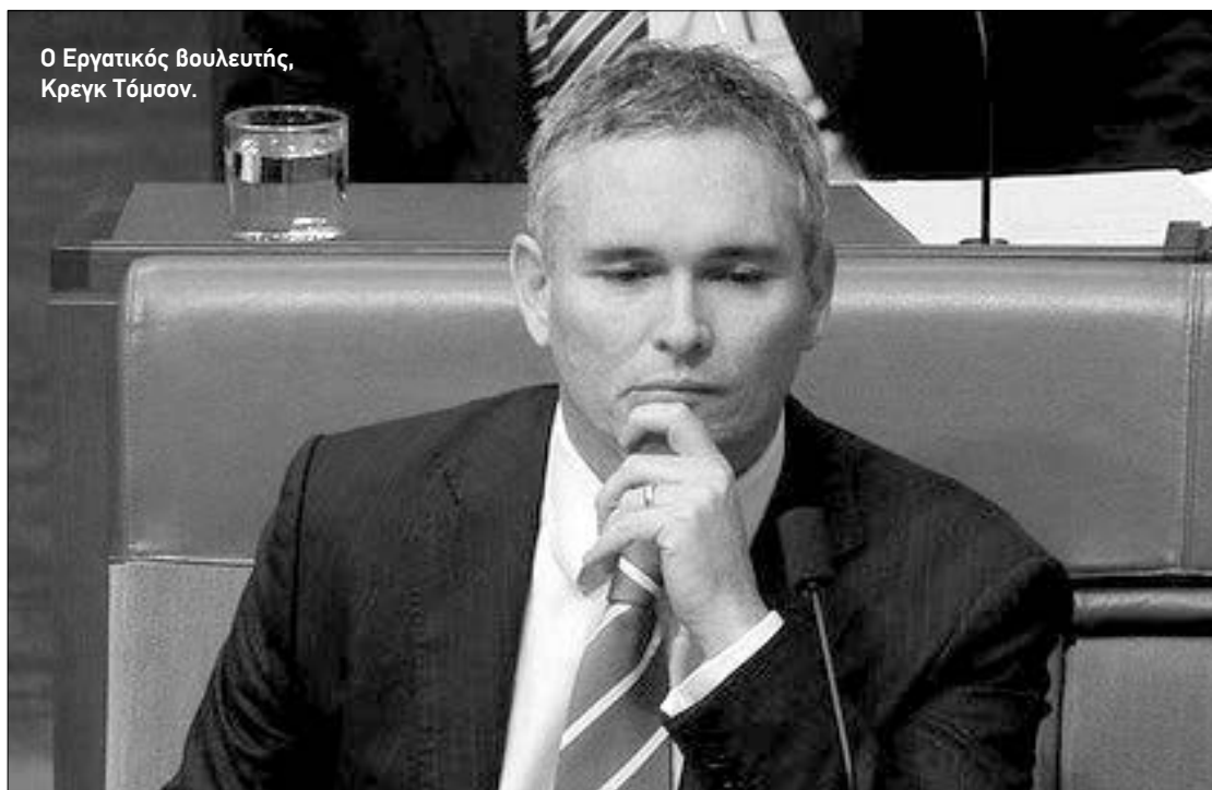
Ο Εργατικός Βουλευτής, Κρεγκ Τόμσον.