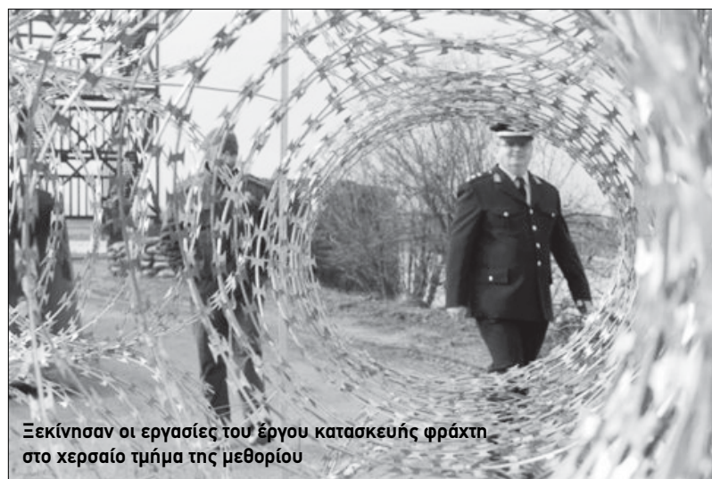
Ξεκίνησαν οι εργασίες του έργου κατασκευής φράχτη στο χερσαίο τμήμα της μεθορίου

που αφορούσαν δεκάδες τηλέφωνα συνεργατών τα οποία πληρώνονταν από το Ελληνικό Δημόσιο δεν είχαν εγκριθεί από το Ελεγκτικό Συνέδριο και έμειναν τελικά απλήρωτοι με αποτέλεσμα να φτάσει το «πλήρωμα του χρόνου» και οι συνδέσεις να κοπούν. Οι λογαριασμοί αυτοί φέρονται να είναι υπέργοκοι οπότε και οι αρμόδιες υπηρεσίες του υπουργείου τελικά δεν τους πλήρωσαν.