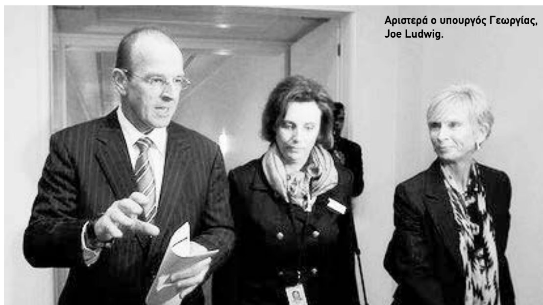
Αριστερά ο υπουργός Γεωργίας, Joe Ludwig.