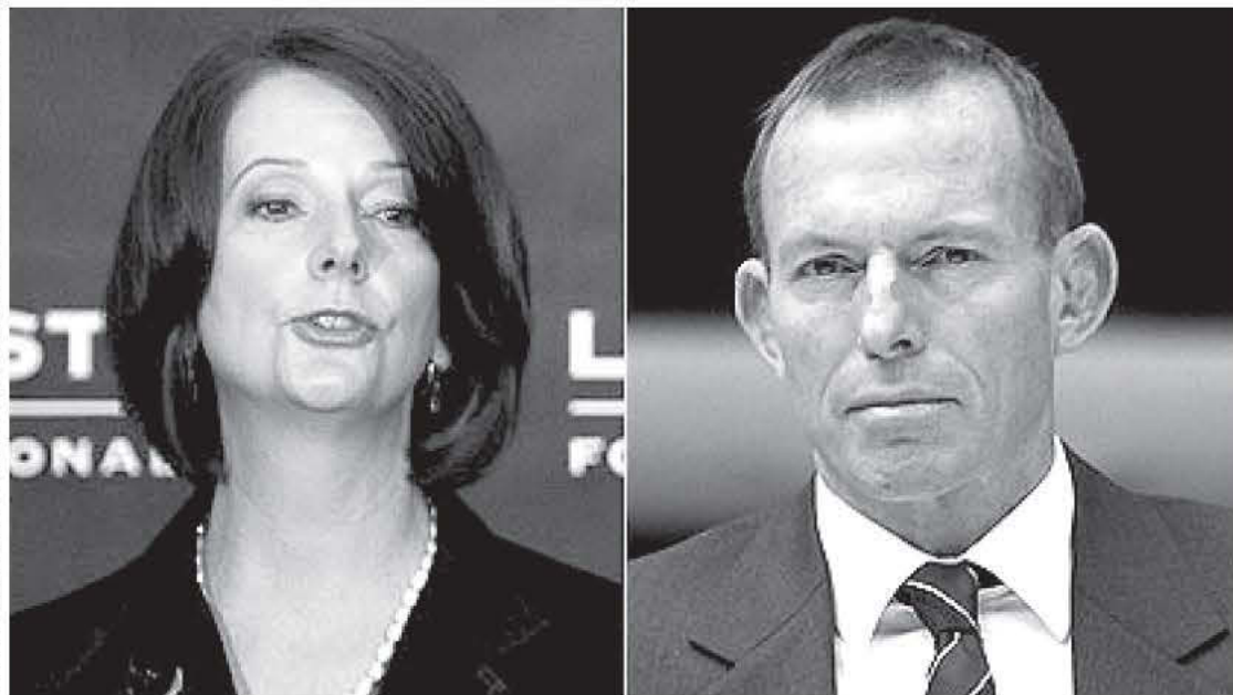
Δημοφιλέστερη του αρχηγού της αξιωματικής αντιπολίτευσης, Τόνι Άμπποτ, είναι η πρωθυπουργός Τζούλια Γκίλαρντ σύμφωνα με την τελευταία δημοσκόπηση της εταιρίας Newsroll.

σημειωθεί ότι τον Ιανουάριο και τον Φεβρουάριο διαγνώστηκαν 94 περιπτώσεις ατόμων που προβλήθηκαν από τον ιό Ross River και άλλες 56 περιπτώσεις ατόμων που προσβλήθηκαν από τον ιό Barmah Forest. Και στις δύο περιπτώσεις τα συμπτώματα είναι κόπωση, πυρετός, εξανθήματα και πρήξιμο στις κλειδώσεις.