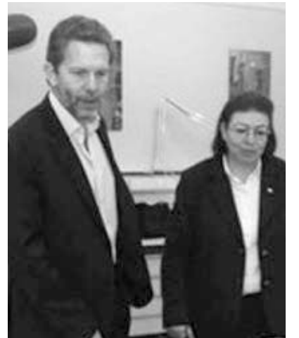
Ο υπουργός Πολιτισμού Παύλος Γερούλανος επισκέφθηκε το Μουσείο συνοδευόμενος από τη γενική γραμματέα του υπουργείου Λίνα Μενδώνη.

«Γνωρίζουμε ότι το Μουσείο Γκετί κρατούσε αυτές τις αρχαιότητες από το 1975 και έχει γίνει μια τεράστια προσπάθεια, διαχρονική, για να φτάσουμε στο σημερινό γεγονός. Θεωρώ ότι η επιστροφή αυτή στέλνει το μήνυμα ότι δεν θα σταματήσουμε την προσπάθεια ανάκτησης κάθε μνημείου που έχει εξαχθεί παράνομα από τη χώρα, μέχρι να διασφαλίσουμε την επιστροφή του και τη τιμωρία αυτών που το έκλεψαν. Η συμφωνία που κάναμε με το Μουσείο Γκετί μάς δίνει επίσης τη δυνατότητα να ανταλλάξουμε τεχνολογία, αλλά και να συνεργαστούμε και σε άλλα πράγματα, που αφορούν