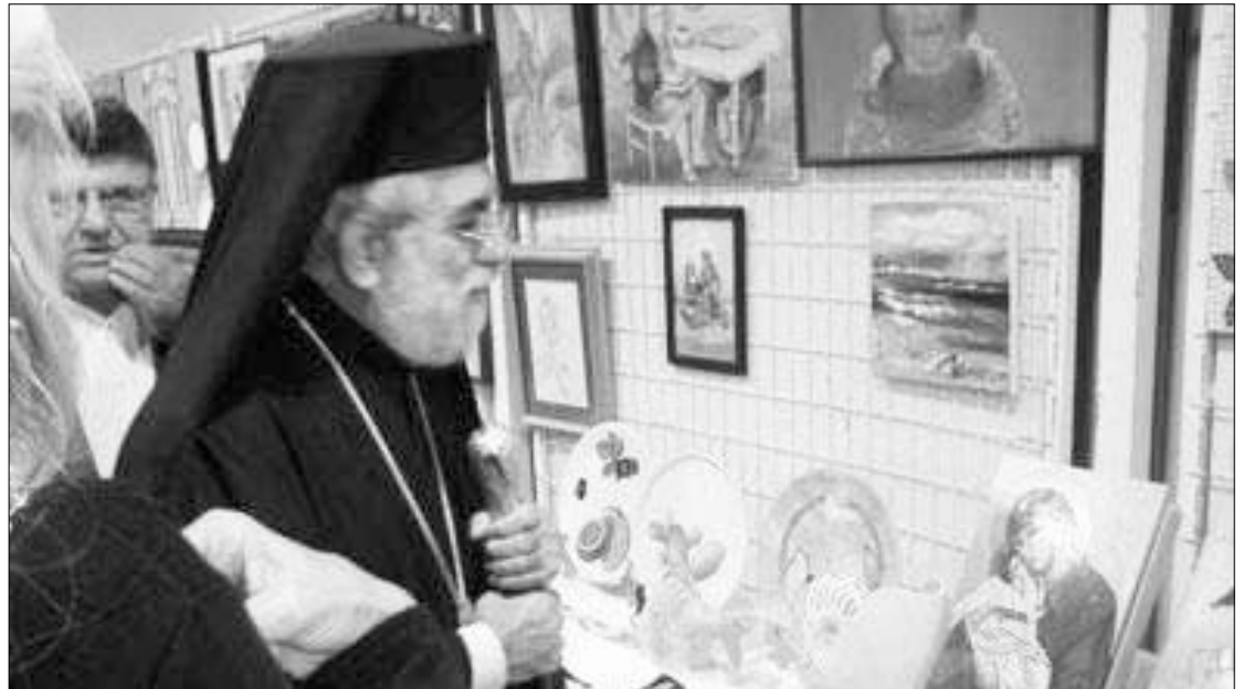
«Έφτασε νομίζω και η Κύπρος να δώσει χείρα βοήθειας προς την μητέρα Ελλάδα», δήλωσε ο Μητροπολίτης Κιτίου.

Νύφη μου το βασιλικό που φέραν στην αυλή σου, να το ποτίζεις ζάχαρη σε όλη τη ζωή σου.