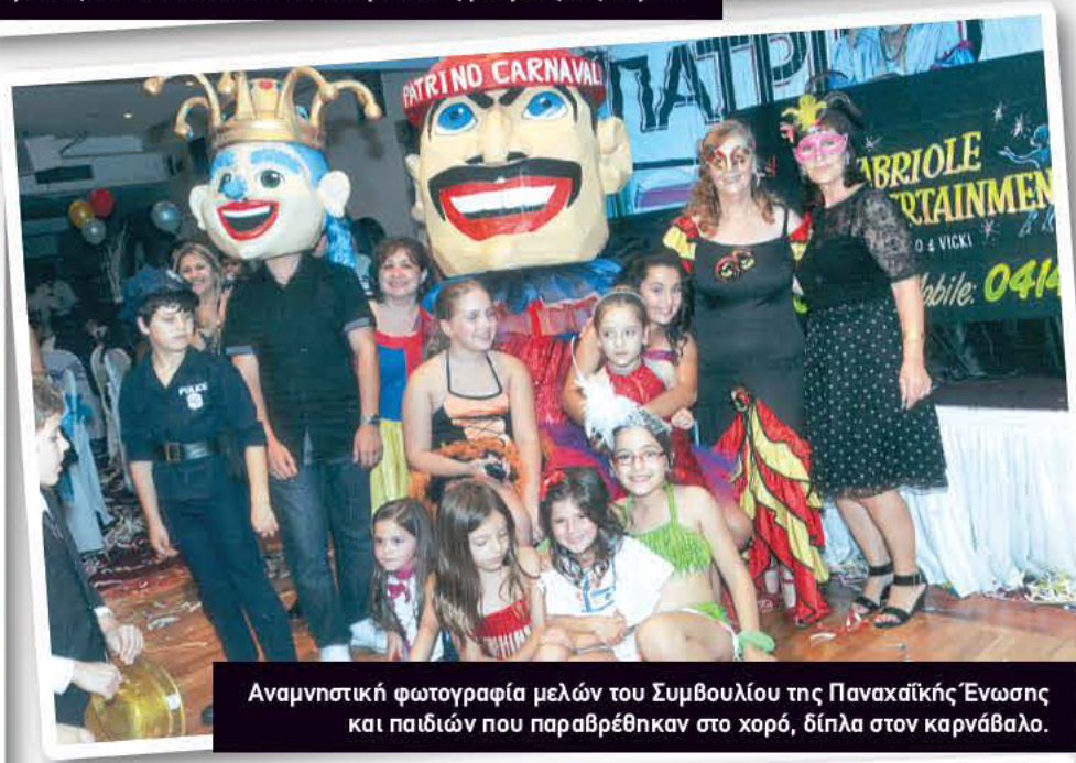
Αναμνηστική φωτογραφία μελών του Συμβουλίου της Παναχαϊκής Ένωσης και παιδιών που παραβρέθηκαν στο χορό, δίπλα στον καρνάβαλο.