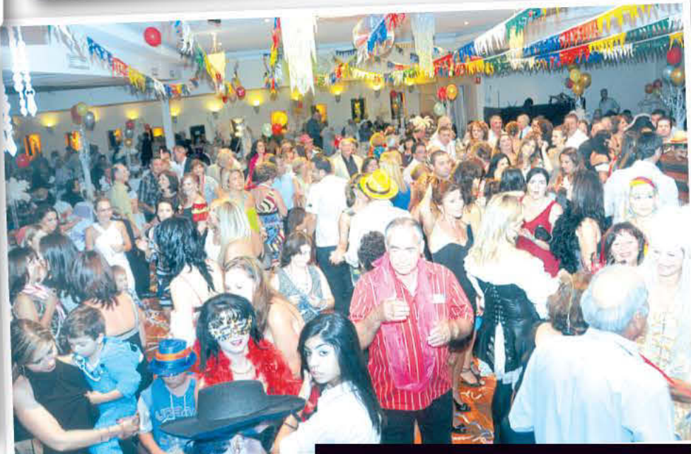
Άποψη του κοινού που παραβρέθηκε στο χορό.