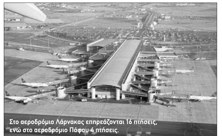
Στο αεροδρόμιο Λάρνακας επηρεάζονται 16 πτήσεις, ενώ στο αεροδρόμιο Πάφου 4 πτήσεις.

Πιο συγκεκριμένα, στο διεθνές αεροδρόμιο Λάρνακας επηρεάζονται 16 πτήσεις, ενώ στο διεθνές αεροδρόμιο Πάφου επηρεάζονται 4 πτήσεις. Σύμφωνα με τον εκπρόσωπο Τύπου των αεροδρομίων της Κύπρου, Αδάμο Ασπρή, «για τις εξαγγελθείσες απεργίες στις 7, 12 και