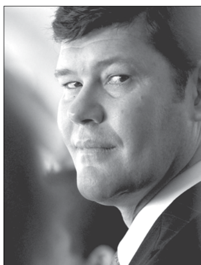
Ο δισεκατομμυριούχος επιχειρηματίας, Τζέιμς Πάκερ.

Την υποστήριξη του στα σχέδια του Τζέιμς Πάκερ για την οικοδόμηση ενός γιγαντιαίου ξενοδοχειακού συγκροτήματος στο Barangaroo, το οποίο θα στεγάζει ένα νέο καζίνο, εξέφρασε χθες ο Πρέμιερ της Ν.Ν.Ο., Μπάρι Ο' Φάρελ, τονίζοντας ότι από την λειτουργία του θα δημιουργηθούν νέες θέσεις εργασίας και θα αυξηθεί η τουριστική κίνηση στο Σίδνεϊ. Ο Όμιλος Crown του δισεκατομμυριούχου επιχειρηματία, θέλει να κατασκευάσει ένα ξενοδοχείο των 350 δωματίων, με καζίνο, σπα και άλλους χώρους ψυχαγωγίας, στο κέντρο του Barangaroo. Να σημειωθεί ότι σύμφωνα με το νόμο, στο Σίδνεϊ δεν μπορεί να λειτουργήσει δεύτερο καζίνο πριν το 2019.