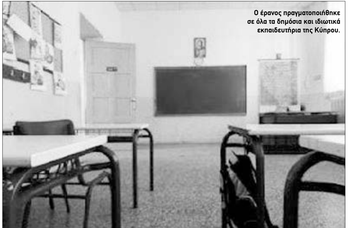
Ο έρανος πραγματοποιήθηκε σε όλα τα δημόσια και ιδιωτικά εκπαιδευτήρια της Κύπρου.

Νύφη μου το βασιλικό που φέραν στην αυλή σου, να το ποτίζεις ζάχαρη σε όλη τη ζωή σου.