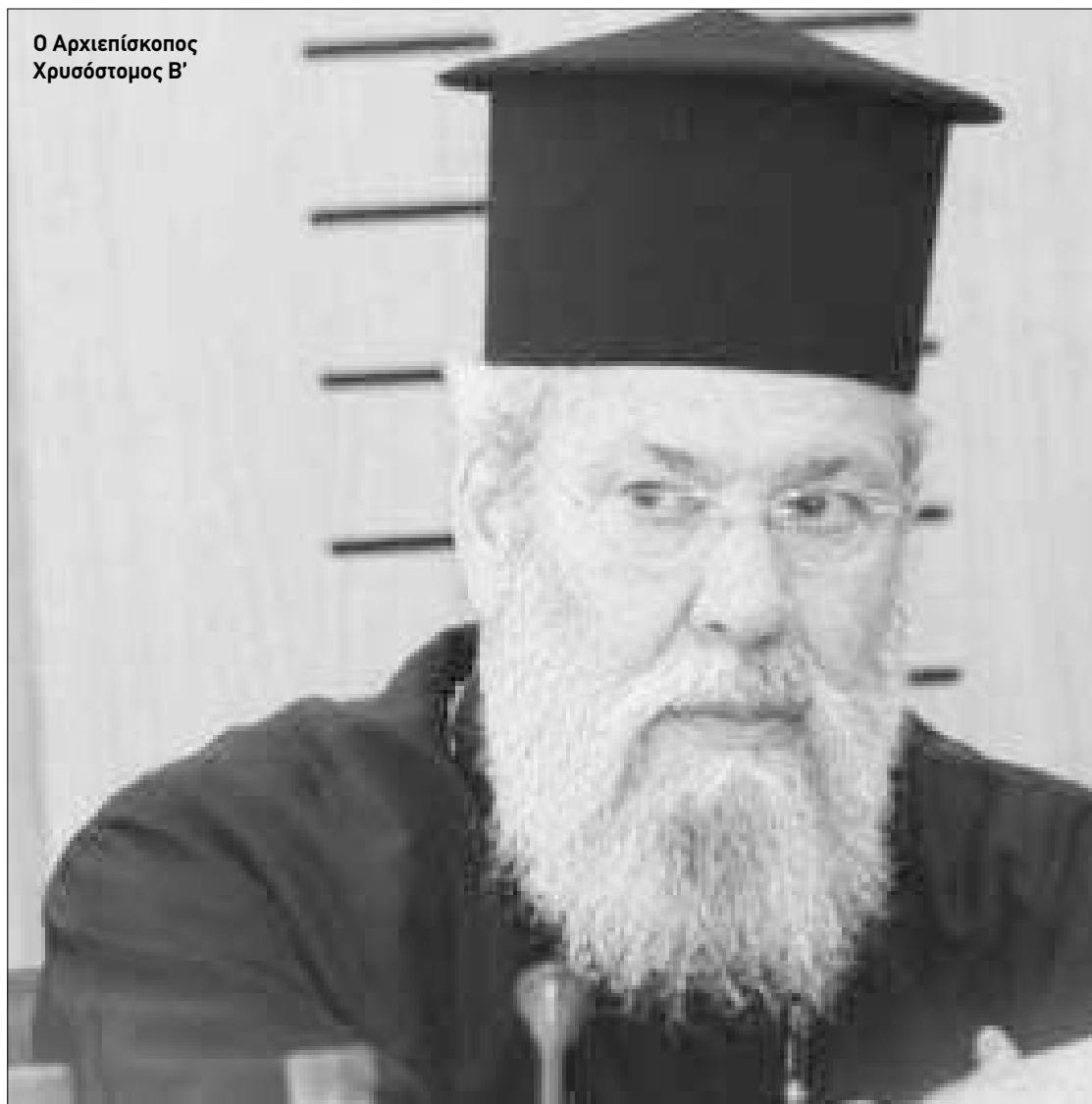
Ο Αρχιεπίσκοπος Χρυσόστομος Β'

Νύφη μου το βασιλικό που φέραν στην αυλή σου, να το ποτίζεις ζάχαρη σε όλη τη ζωή σου.