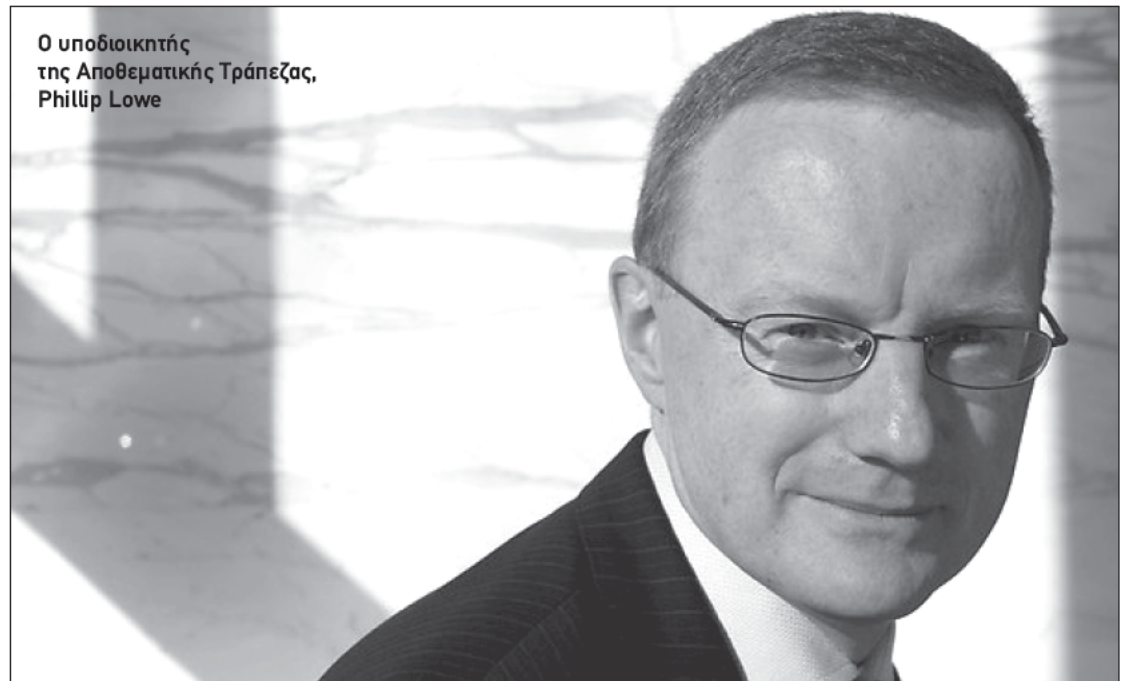
Ο υποδιοικητής της Αποθεματικής Τράπεζας, Phillip Lowe

ΣΥΜΦΩΝΑ ΜΕ ΤΟΝ ΥΠΟΔΙΟΙΚΗΤΗ ΤΗΣ ΑΠΟΘΕΜΑΤΙΚΗΣ ΤΡΑΠΕΖΑΣ