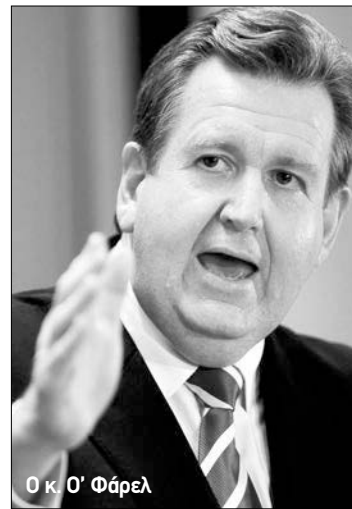
Ο κ. Ο' Φάρελ

Την απόφασή της κυβέρνησής του να προχωρήσει στην άρση της απαγόρευσης εξόρυξης ουρανίου στην πολιτεία, ανακοίνωσε χθες ο πρωθυπουργός της Ν.Ν.Ο., Μπάρνι Ο' Φάρελ. «Είναι καιρός για τη Ν.Ν.Ο. να εκμεταλλευθεί κάθε ευκαιρία που της παρουσιάζεται στον τομέα εξόρυξης μεταλλευμάτων, από το οποίο επωφελούνται ήδη σε μεγάλο βαθμό η Δυτική Αυστραλία, το Κουίνσλαντ και η Νότια Αυστραλία, τόσο οικονομικά όσο και στη δημιουργία νέων θέσεων εργα-