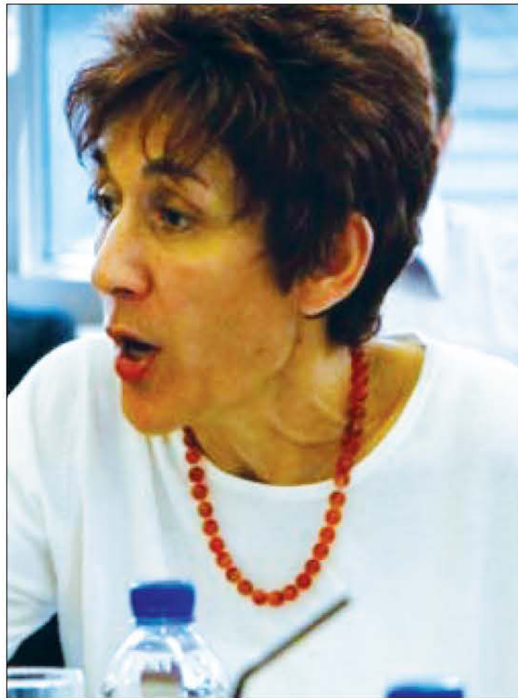
Στην Ολομέλεια της Βουλής στέλνει η Επιτροπή Εμπορίου πρόταση νόμου που προβλέπει κατάργηση της συμβουλευτικής επιτροπής για το φυσικό αέριο και σύσταση τεχνικής επιτροπής, ενέργεια με την οποία διαφωνεί η υπουργός Εμπορίου (αριστερά).