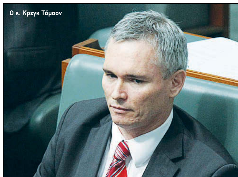
Ο κ. Κρεγκ Τόμσον

ΓΙΑ ΤΗΝ ΥΠΟΘΕΣΗ ΤΟΥ ΒΟΥΛΕΥΤΗ ΚΡΕΓΚ ΤΟΜΣΟΝ