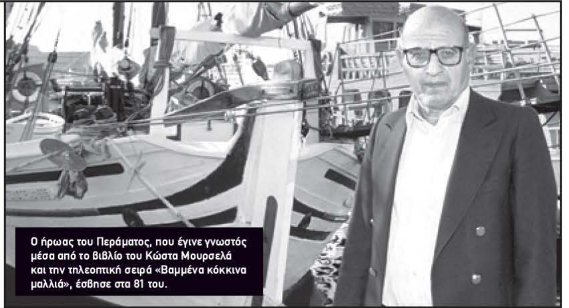
Ο ήρωας του Περάματος, που έγινε γνωστός μέσα από το βιβλίο του Κώστα Μουρσελά και την τηλεοπτική σειρά «Βαμμένα κόκκινα μαλλιά», έσβησε στα 81 του.