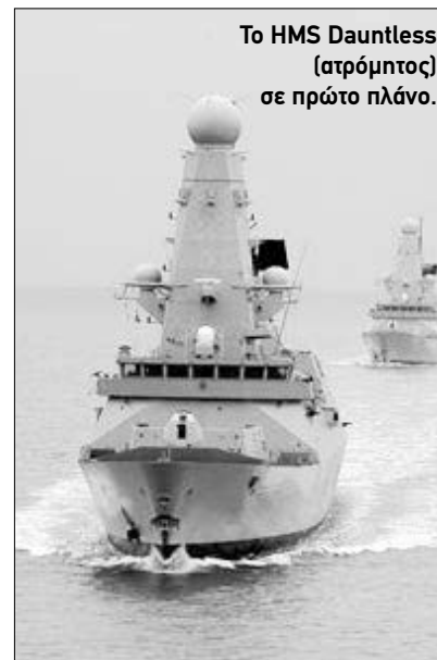
Το HMS Dauntless (ατρόμπος) σε πρώτο πλάνο.

Αλλά και η ίδια η πρόεδρος της χώρας Κριστίνα Φερνάντες, στην πρώτη της εμφάνιση μετά την αναρωτική άδεια που έλαβε, χαρακτήρισε «ανοπίστευτες» τις δηλώσεις Κάμερον, ξεκαθαρίζοντας ότι στην υπόθεση των Νησιών, «δεν είμαστε εμείς οι κακοί». Η Φερνάντες επανέλαβε ότι η χώρα επιθυμεί να λύσει διπλωματικά το θέμα των Νήσων, βάσει των ψηφισμάτων του Συμβουλίου Ασφαλείας του ΟΗΕ. «Σε καμία περίπτωση δεν επιθυμούμε να υποδείξουμε εμείς στους κατοίκους των Νησιών που θέλουν να ανήκουν και τι θέλουν να είναι» δήλωσε. Υπενθύμισε δε ότι ο πόλεμος του 1982 δεν έγινε από το λαό της Αργεντινής, αλλά μία δικτατορία, την οποία ο λαός πλήρωσε πολύ ακριβά. Πάντως, το βρετα-