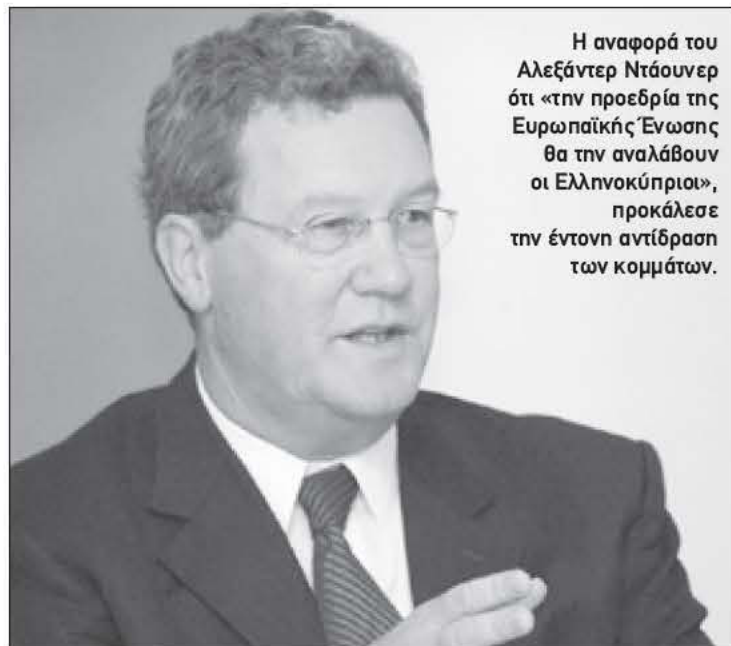
Η αναφορά του Αλεξάντερ Ντάουνερ ότι «την προεδρία της Ευρωπαϊκής Ένωσης θα την αναλάβουν οι Ελληνοκύπριοι», προκάλεσε την έντονη αντίδραση των κομμάτων.