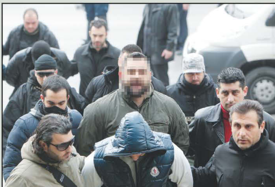
Προφυλακιστέοι κρίθηκαν άλλοι οκτώ κατηγορούμενοι για συμμετοχή σε τέσσερα κυκλώματα εκβίασης και τοκογλυφίας, ανάμεσά τους και ο επικεφαλής της Επιχειρησιακής Διεύθυνσης Ειδικών Υποθέσεων Θεσσαλονίκης του ΣΔΟΕ, μετά τις σημερινές τους απολογίες ενώπιον του Γ' τακτικού ανακριτή Θεσσαλονίκης.

Οι αστυνομικές έρευνες άρχισαν τον περασμένο Μάιο, κατόπιν επώνυμης καταγγελίας πολίτη, τη στιγμή που εκτιμάται ότι από τη δεκαετή και πλέον δράση των κυκλωμάτων, έπεσαν θύματα περισσότεροι από 2.000 επιχειρηματίες, ιδιώτες και ελεύθεροι επαγγελματίες. Οι Αρχές συνδέουν τη δράση των τοκογλυφικών αυτών κυκλωμάτων με την αυτοκτονία του 45χρονου επιχειρηματία της Θεσσαλονίκης, ο οποίος δραστηριοποιούνταν στο χώρο της εστίασης. Όπως έγινε γνωστό, ο 45χρονος, που πήδηξε από το μπαλκόνι του σπιτιού του