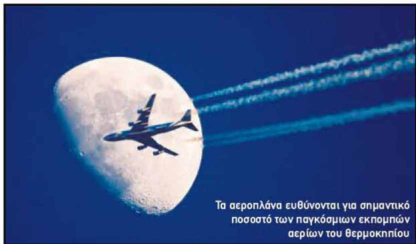
Τα αεροπλάνα ευθύνονται για σημαντικό ποσοστό των παγκόσμιων εκπομπών αερίων του θερμοκηπίου

Το Ευρωπαϊκό Δικαστήριο απέρριψε τελικά τις αιτήσεις - και τις απειλές - των ΗΠΑ και έκρινε ότι ο φόρος άνθρακα που θα επιβάλλει η ΕΕ στις αερομεταφορές από την 1η Ιανουαρίου 2012 δεν παραβιάζει διεθνείς συμφωνίες και μπορεί να εφαρμοστεί. Η απόφαση σημαίνει ότι από το νέο έτος όλες οι αεροπορικές εταιρείες που πετούν από και προς την ΕΕ θα πρέπει να αγοράζουν δικαιώματα εκπομπής αερίων του θερμοκηπίου, όπως ισχύει ήδη και για άλλες ρυπογόνες βιομηχανίες.