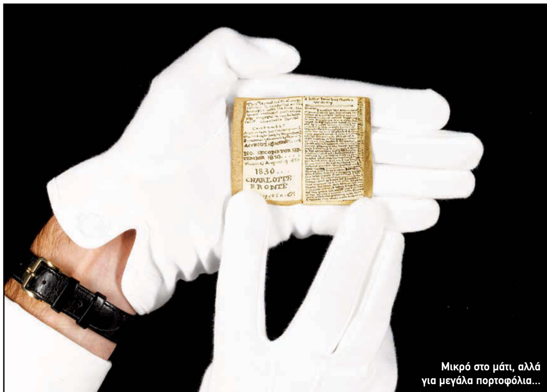
Μικρό στο μάτι, αλλά για μεγάλα πορτοφόλια...