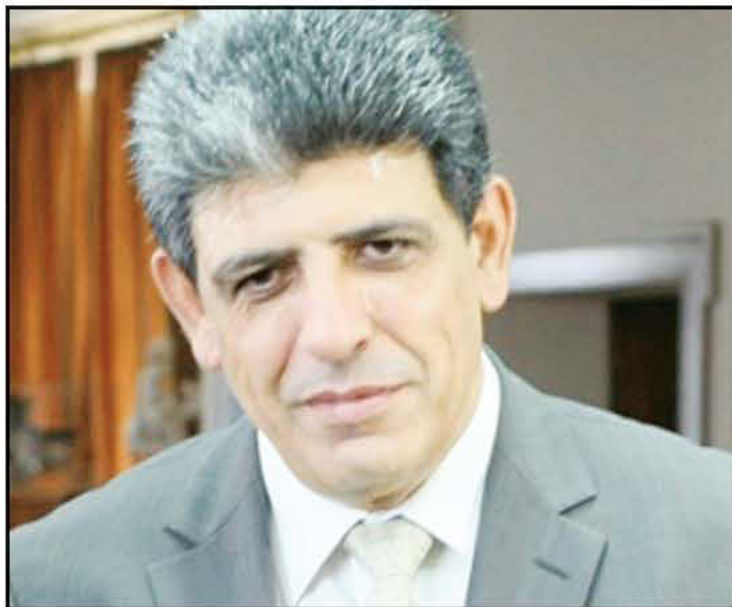
Ο Κύπριος υπουργός Εσωτερικών Νεοκλής Συλικιώτης.

Μιλώντας σε συνέντευξη Τύπου ο Κύπριος υπουργός Εσωτερικών Νεοκλής Συλικιώτης αναφέρθηκε ιδιαίτερα στις προσπάθειες για διαμόρφωση ενός κοινού ευρωπαϊκού συστήματος ασύλου, ενώ παράλληλα υπογράμμισε πως αυτό που χρειάζεται είναι «περισσότερη Ευρώπη και όχι λιγότερη Ευρώπη» και ότι η ΕΕ πρέπει να ενεργήσει περισσότερο συντονισμένα και να αναδείξει περισσότερο τις αρχές της. Αναφερόμενος στην προτεραιότητα της ένταξης των μεταναστών, ο υπουργός