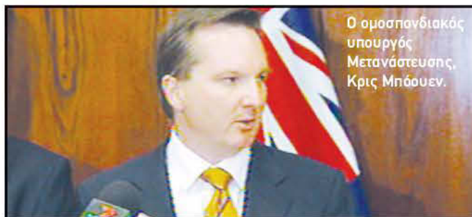
Ο ομοσπονδιακός υπουργός Μετανάστευσης, Κρις Μπούουεν.

Ο κ. Μπούουεν, σύμφωνα πάντα με τις ίδιες πληροφορίες, ήταν ένας από τους 6 υπουργούς. «Διαψεύδω κατηγορηματικά τις φήμες. Η Τζού-