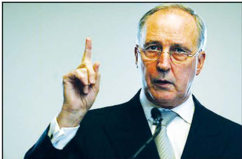
Ο πρώην πρωθυπουργός της χώρας, Πολ Κίτιγκ.

λια Γκίλαρντ έχει την αμέριστη υποστήριξή μου», ήταν η χαρακτηριστική δήλωση του κ. Μπούουεν.