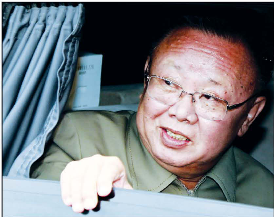
ΣΕ ΗΛΙΚΙΑ 69 ΕΤΩΝ