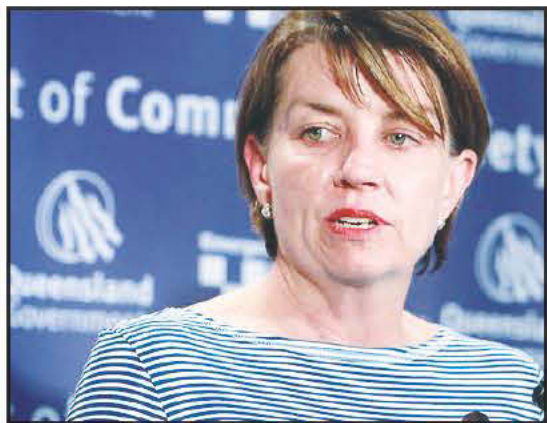
Κερδίζει έδαφος η κυβέρνηση της Άννα Μπλάι στο Κουίνσλαντ.

Οι νέες αμοιβές των Αυστραλών πολιτικών θα κοστίσουν στους φορολογούμενους της χώρας 20 επιπλέον εκατομμύρια δολάρια ετησίως.