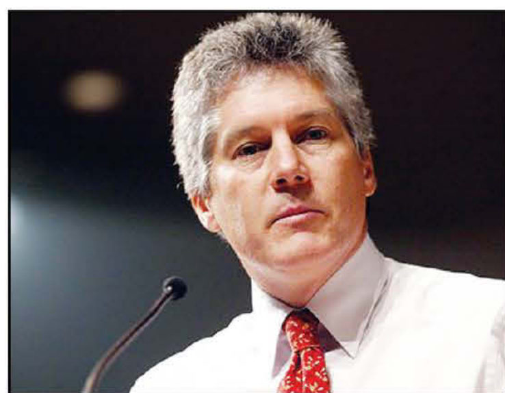
Ο υπουργός Άμυνας, Στίβεν Σμιθ

Και ενώ η πολιτική κρίση συνεχίζεται, ισχυρός σεισμός μεγέθους 7,3 βαθμών σημειώθηκε στα νοτιοδυτικά της πόλης Λάε στην Παπούα Νέα Γουϊνέα, σύμφωνα με το Αυστραλιανό Γεωλογικό Ινστιτούτο. Το επίκεντρο