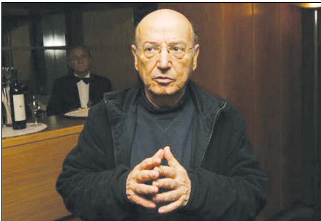
«Η κατάσταση είναι απαίσια, όλα αυτά για τα οποία πολεμήσαμε, δεν ήρθαν ποτέ, η Ευρώπη έγινε ένα όνειρο που γρήγορα κατέρρευσε και δεν βλέπω διέξοδο» έχει δηλώσει ο Θόδωρος Αγγελόπουλος.