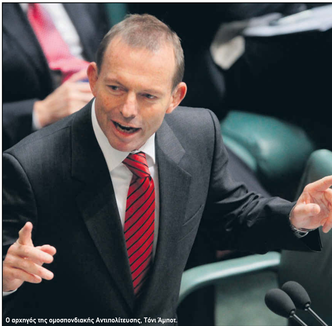
Ο αρχηγός της ομοσπονδιακής Αντιπολίτευσης, Τόνι Άμποτ.

Το Αυστραλιανό Χριστιανικό Λόμπι, υποστηρίζει ότι η κυβέρνηση Γκίλαρντ θα πληρώσει πολύ ακριβά το τίμημα της απόφασης που λήφθηκε στο Εθνικό Συνέδριο του Κόμματος να υποστηρίξει τους γάμους ομοφυλόφιλων.