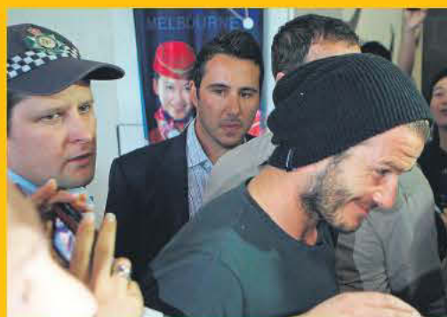
Μοίρασε χαμόγελα και αυτόγραφα στην Μελβούρνη ο Ντέιβιντ Μπέκαμ

Ο Ντέιβιντ Μπέκαμ και η παρέα του από το Λος Άντζελες, θα παραταχθούν απόψε στο Etihad Stadium της Μελβούρνης στις 19:30, αντιμετωπίζοντας την Βίκτορι σε έναν αγώνα φιλικού χαρακτήρα. Όχι ότι θα τρελαθούμε που Μπέκαμ και Κιούελ θα βρεθούν αντιμέτωποι, όμως έναν Μπέκαμ είναι δύσκολο να ξαναδούμε στην Αυστραλία. (σημ. είδατε για τον Χάρι δεν αναφερόμαστε, τον Χάρι που μάλλον χάρη του κάνει η Βίκτορι και τον κρατά στην ομάδα της). Ο αγώνας θα έχει «ζωντανή» τηλεοπτική κάλυψη.