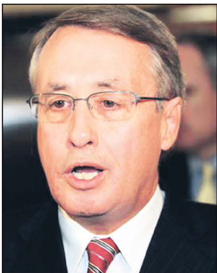
Ο οικονομικός προϋπολογισμός του 2012 - 2013 θα έχει πλεόνασμα $1,5 δισ, δηλώνει ο υπουργός Θησαυροφυλακίου Γουέϊν Σουάν

Ο Θησαυροφύλακας ανακοίνωσε περικοπές ύψους 11,5 δισ. δολαρίων, προκειμένου να πετύχει η κυβέρνηση τους στόχους για επιστροφή του προϋπολογισμού σε πλεόνασμα $1,5 δισ στο οικονομικό έτος 2012-2013.