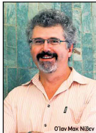
Ό'αν Μακ Νίβεν

Οι ερευνητές ανακάλυψαν ψαροκόκαλα από 23 διαφορετικά είδη ψαριών τα οποία είχαν αποτελέσει τροφή των κατοίκων της περιοχής. Η ραδιοχρονολόγηση των ευρημάτων έδειξε ότι ορισμένα από αυτά έχουν ηλικία 42 χιλιάδων ετών. Εξαιρετικά ενδιαφέρον είναι το γεγονός ότι ανάμεσα στα ψάρια υπάρχουν τόνοι και άλλα είδη που ζουν σε μεγάλα βάθη γεγονός που αποδεικνύει ότι