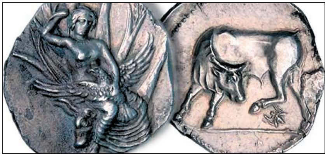
Ξεπέρασε τις προσδοκίες η δημοπρασία αρχαίων ελληνικών νομισμάτων που έγινε από τον οίκο Morton & Eden LTD σε συνεργασία με τον διεθνούς φήμης οίκο Sotheby's.