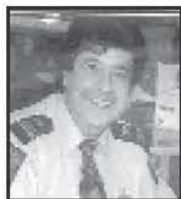
Lic. No: 2ta06709

Η ΕΛΛΗΝΙΚΗ ΑΝΤΙΣΤΑΣΗ είναι η έκφραση Ηθικής επιταγής και ξεκινάει από την Αρχαία Ελληνική Εποχή. Τα Μεγαλειώδη Κινήματα των Ελευθερών Ανθρώπων δια μέσου των αιώνων κατέληξαν στον Καταστατικό Χάρτη των Ανθρώπινων Δικαιωμάτων της Εποχής μας. Χωρίς Αντίσταση δεν θα είχαμε Αναγέννηση, Γαλλική Επανάσταση, Αμερικανική Επανάσταση, Εικοσιένα και οι εκλάμψεις αυτού το 1912 -13, 40 - 41, 41 - 44, Πολυτεχνείο 1973. Στην Ελλάδα υπήρχαν από Αρχαιοτάτων χρόνων οι Άγριοι Νόμοι (Αντιγόνη Σοφοκλή) και η Ελεύθερη Ηθική Συνείδηση του Ανθρώπου, που υποχρέωναν τους Έλληνες να τα Τηρούν ενάντια σε κάθε Τυραννική ή Εχθρική Εξουσία. Και τα επέτησαν σαν κόρη οφθαλμού. Το Δίκαιο της Αντίστασης έλαβε πάντα στη Χώρα μας σάρκα και οστά κατά του Εξωτερικού και Εσωτερικού εχθρού. Προϊόν της Αντίστασης πάντα ήταν η Ελευθερία, το Πολυτιμότερο Αγαθό του Ανθρώπου. Γι' αυτό Αξίζει κάθε Δόξα και Τιμή στους Ήρωες της Εθνικής Αντίστασης.