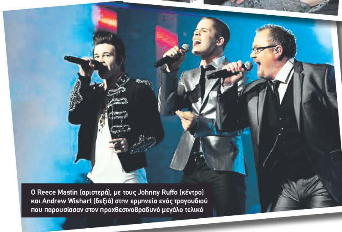
Ο Reece Mastin (αριστερά), με τους Johnny Ruffo (κέντρο) και Andrew Wishart (δεξιά) στην ερμηνεία ενός τραγουδιού που παρουσίασαν στον προχθεσινό βραδυνό μεγάλο τελικό